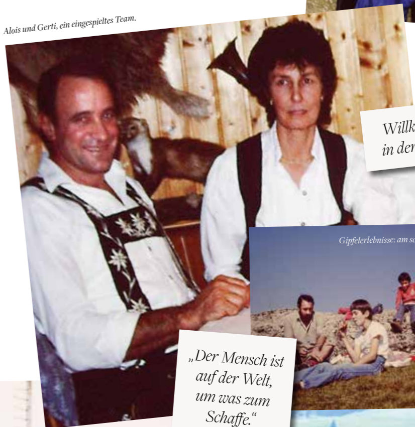
Willkommen in der Familie