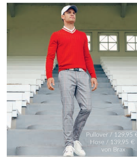
Pullover / 129,95 € Hose / 139,95 € von Brax