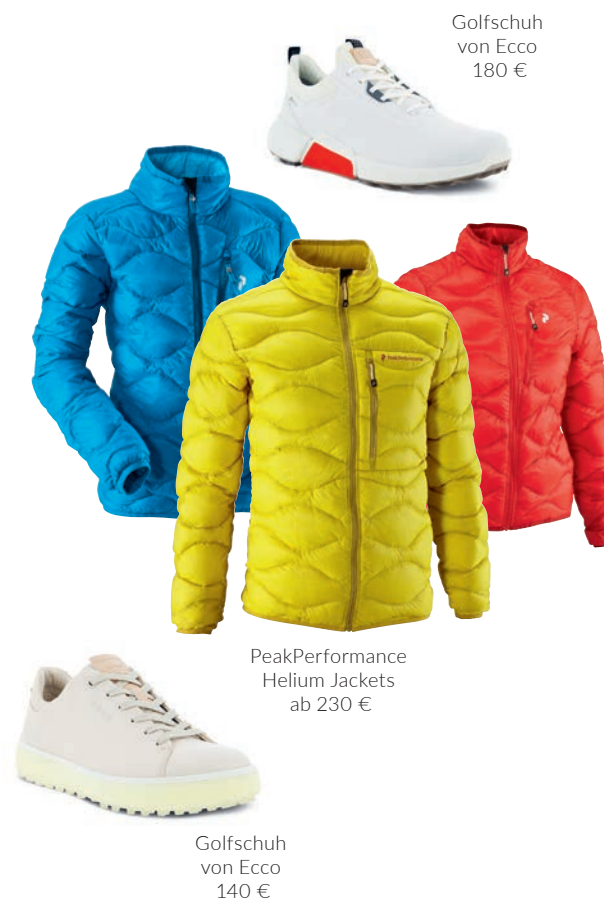
Golfschuh von Ecco 180 €